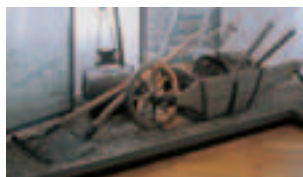
Gartenwerkzeuge im Gartenkunst-Museum Fantaisie

Dauer: ca. 60 Minuten · max. 25 Personen