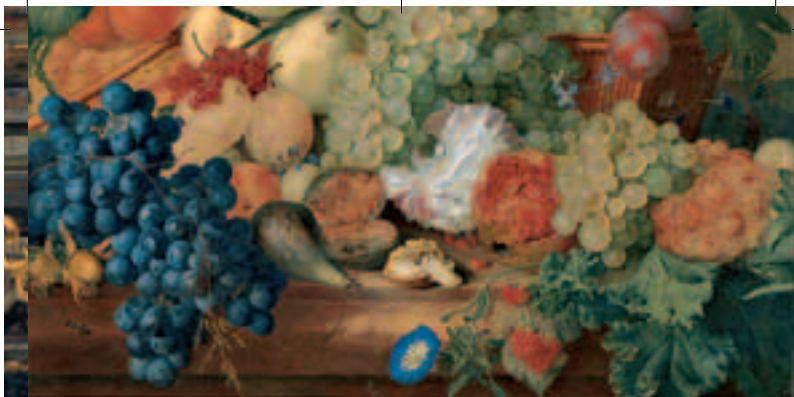
Stilleben in der Staatsgalerie im Neuen Schloss

14.00 Uhr Themenführung Neues Schloss Bayreuth