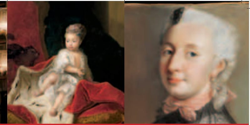
Wilhelmine als Kind und als Markgräfin von Bayreuth