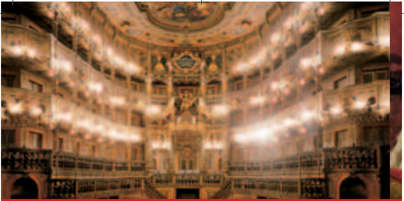
Zuschauerraum des Markgräflichen Operhauses

Willkommen zu den Residenztagen Bayreuth!