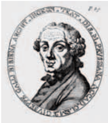
Bildnis des Giuseppe Galli Bibiena, Radierung

Rechts: Potpourri- Vase, Meißen, um 1878