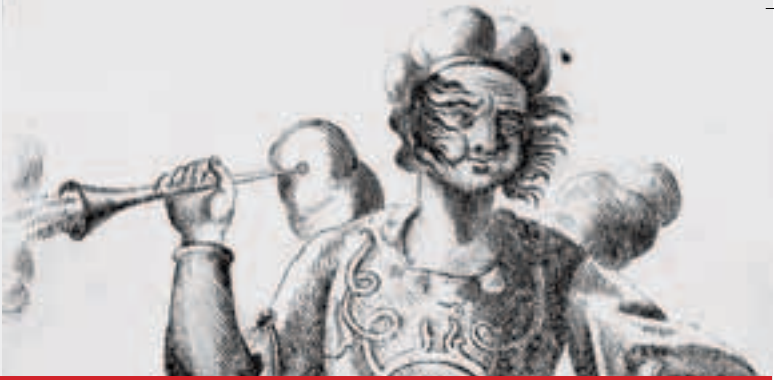
links: Bacchus, rechts: Äolus