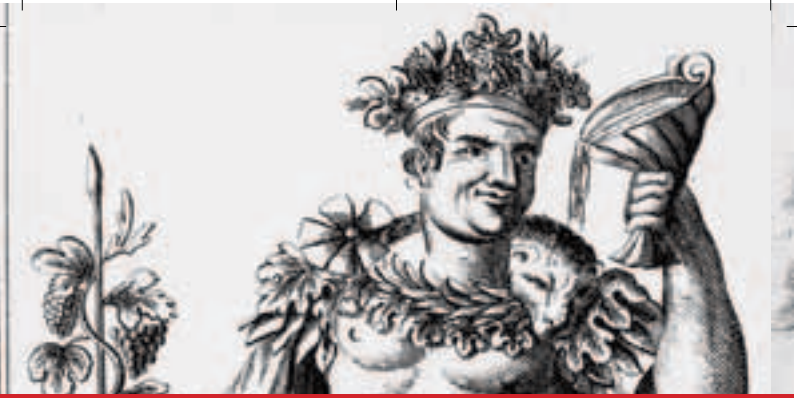
Beispiele barocker Bühnenkostüme aus der Bayreuther Stichsammlung,