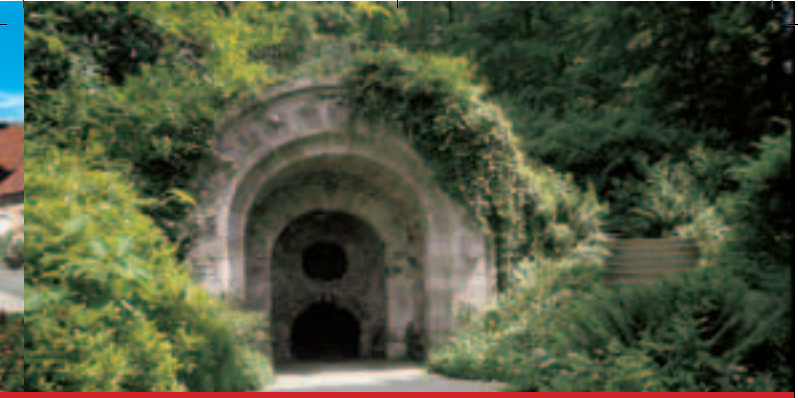
Drachenhöhle im Hofgarten der Eremitage

11.00 Uhr Themenführung Altes Schloss Eremitage