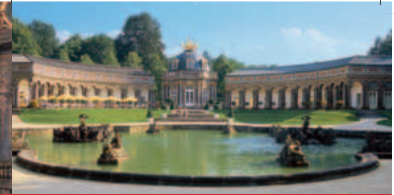
Neues Schloss Eremitage