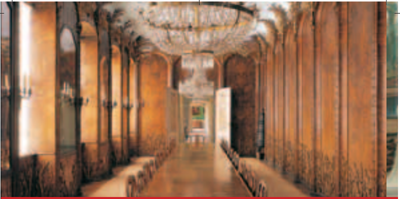
Das Palmenzimmer im Neuen Schloss