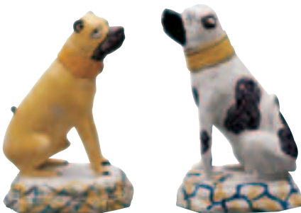
Zwei Fayencen aus der Bayreuther Manufaktur, um 1720

Begleitpersonen benötigen eine Eintrittskarte