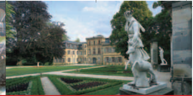
Schloss Fantaisie mit Skulpturenschmuck aus der Zeit des Historismus