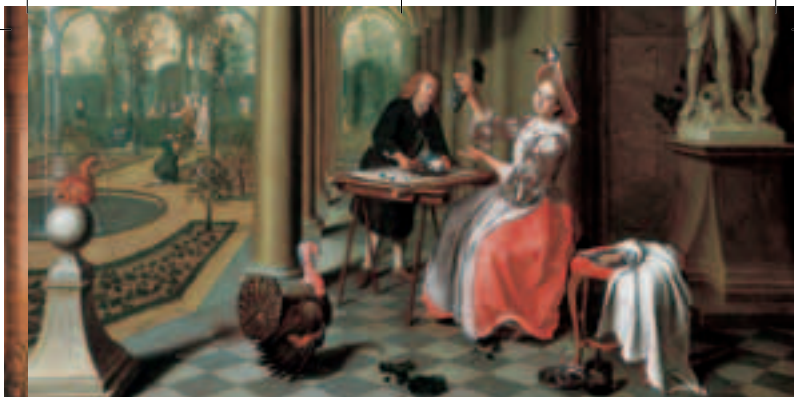
Höfische Gartenszene, um 1750, Gartenkunst-Museum Fantaisie