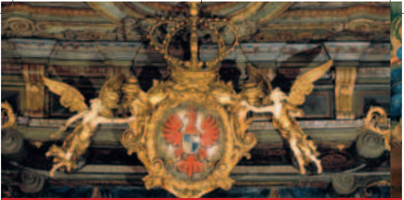
Das Rote-Adler-Emblem mit der Königskrone Wilhelmines im Opernhaus