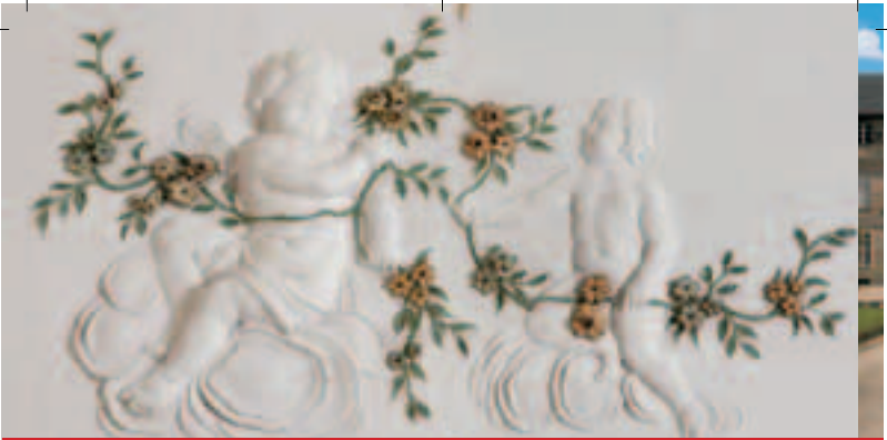
Stuckdekoration im Gartensaal des Italienischen Baus im Neuen Schloss