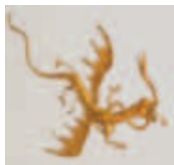
Detail des Deckenstücks im Palmen- zimmer, Neues Schloss

Begleitpersonen benötigen eine Eintrittskarte