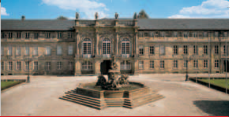
Neues Schloss Bayreuth

13.00 Uhr Kinderführung Neues Schloss Bayreuth (6–12 Jahre)