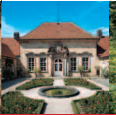
Grotte im Alten Schloss Eremitage