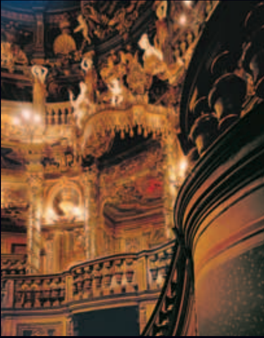
Blick in die Fürstenloge des Markgräflichen Opernhauses Abb. Vorderseite: Prinzessin Wilhelmine von Bayreuth, Gemälde von Antoine Pesne, um 1734, im Neuen Schloss Bayreuth